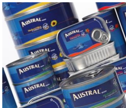
Austra es una de las principales empresas exportadoras de conservas de caballa.

+ 34 918 293 609 SKYPE: fishinformation contactus@fis.com